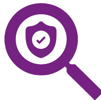
Tableau de résumé des garanties de Responsabilité Civile