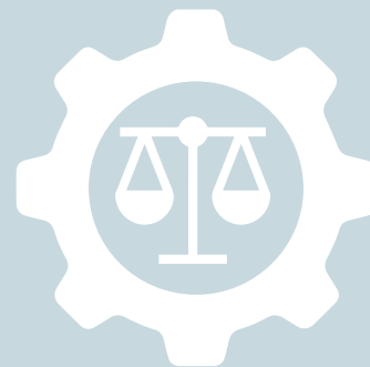
Tableau de résumé des garanties de la Protection Juridique